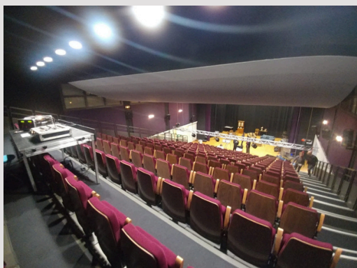
Notre studio ← Votre salle de spectacle